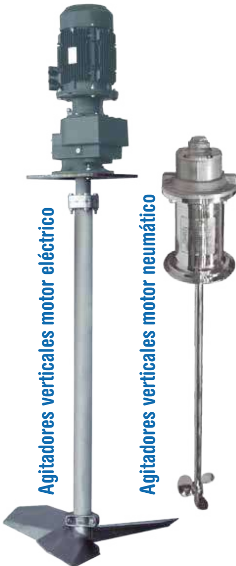
Agitadores verticales motor eléctrico